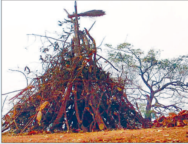
सुरक्षा की चाक चौबंद व्यवस्था

होली के त्योहार को देखते हुए बाजार में भी काफ़ी रौनक दिखाई दे रही है। आस-पड़ोस के गाँवों अंचलों से लोगों की भारी भीड़ होली की खरीददारी करने जिला मुख्यालय के बाजार में उमड़ रही है। नगर में होली का बाजार भी सजकर तैयार हो चुका है और रंग, गुलाल, पिचकारी सहित होली उपयोगी दूसरी सामग्रियों की दुकानें दुकानें लगाई गई हैं। इसके अलावा नगर के बाजार में होली के लिए नगाड़े भी खूब बिक रहे हैं। कुल मिलाकर नगर के बाजार में होली का उत्साह साफ नजर आ रहा है।